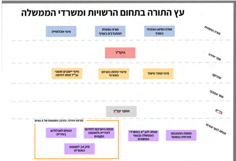
איור 1: מיקום הספר בעץ הידע החילי